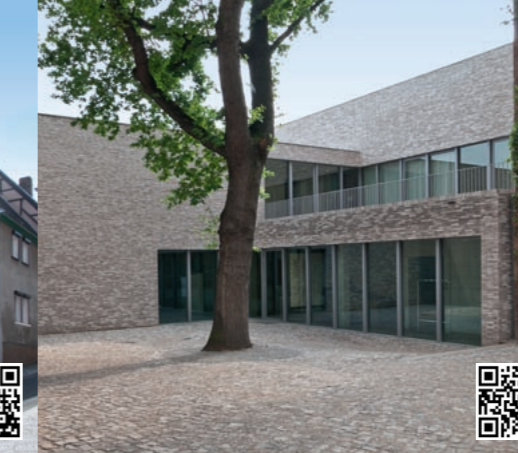
4 Luthers Sterbehaus, Erweiterung und Sanierung* (2014), Andreaskirchplatz 7, Lutherstadt Eisleben