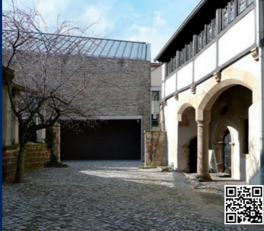
1 Museum Luthergeburts- und Elternhaus, Sanierung und Erweiterung* (2007), Lutherstraße 15–17, Lutherstadt Eisleben

* Im Rahmen von Architekturpreisverfahren ausgezeichnet