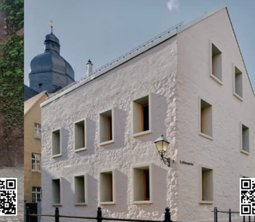
5 Lutherarchiv (2015), Seminarstraße 2, Lutherstadt Eisleben