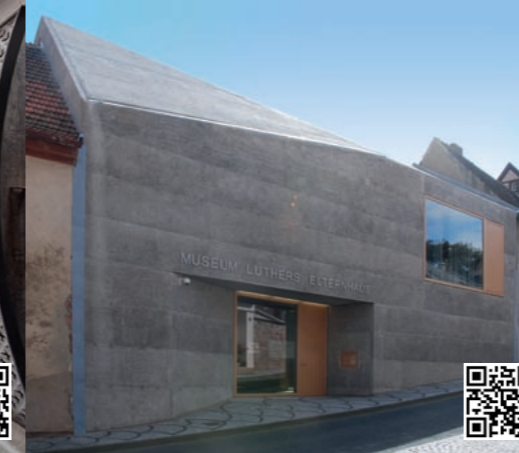
3 Luthers Elternhaus Dauerausstellung (2014), Lutherstraße 26, Mansfeld-Lutherstadt